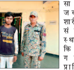
पुलिस के अनुसार प्रार्थीया द्वारा थाना मोहला में रिपोर्ट दर्ज कराई गई कि उसकी नाबालिग पुत्री 15 मार्च 2025 को सुबह लगभग 10.30 बजे मोहला आई थी। इसी दौरान आरोपी द्वारा बहला-

फुसलाकर उसे सुनसान फॉरेस्ट डिपो जंगल क्षेत्र में ले जाकर उसके नाबालिग से कुकर्म करने के मामले में फरार आरोपी को गिरफ्तार कर पुलिस ने कार्रवाई की है।