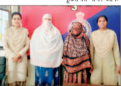
पत्र माननीय न्यायालय में प्रस्तुत किया जा चुका था तथा अन्य फरार आरोपियों की तलाश जारी थी।

पुलिस के अनुसार प्रार्थी द्वारा 10 अगस्त 2024 को थाना बसंतपुर में लिखित शिकायत प्रस्तुत कर बताया गया कि उसकी माता एवं अन्य महिला के नाम दर्ज ग्राम कातुलबोर्ड स्थित खसरा नंबर 48/1 रकबा 1.10 डिसेमिल